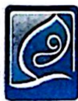
موسه یزکی نل امید Hope Generation Foundation

شماره ۱۳۹۶۵۰۸۴۰۰۰۱۰۹۷۲۹۷ آگهی تقاضای ثبت علامت تجاری